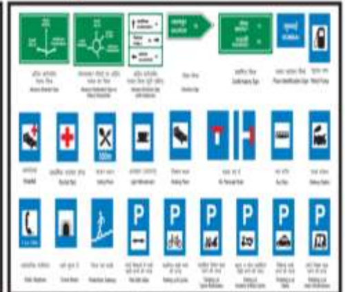
Signage hoarding (8' X 4')