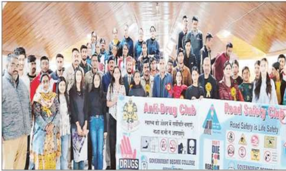
रोहड़ू : राजकीय स्नातकोत्तर महाविद्यालय सीमा में जागरूकता कार्यक्रम में मौजूद महाविद्यालय स्टाफ व विभिन्न विभागों के अधिकारी तथा सुरक्षा क्लब के छात्र-छात्राएं सामूहिक चित्र में।

बलवान। सह माग कार्यक्रम म । वनरा माउटा ग कहा ह । क । सामाजन आर सामाजन क । ह । उन्हान छात्र-छात्राआ स लाकतात्रक प्रणाला साता दवा व धमन्द्र व हम राज साहल मुख्य वक्ता रहे। रक्षा और दो तकनीकी सत्रों और संगोष्ठी व्यापक परिप्रेक्ष्य पर प्रकाश डाला। का गहनता से अध्ययन करने का आग्रह किया। अन्य उपस्थित रहे।