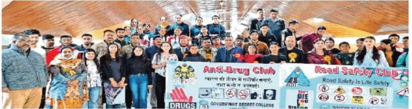
सीमा कालेज में आयोजित सड़क सुरक्षा एवं नशा निवारण पर आयोजित कार्यशाला में मौजूद विद्यार्थी व अन्य